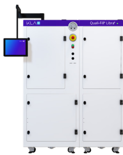
アドオン付き2キャビネットシステム (Sn, Sn-Ag, Ni, Au)