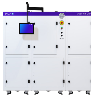
3キャビネットの完全分析システムとソリューション