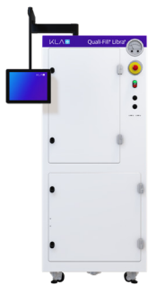
マスターモジュール (Cu)